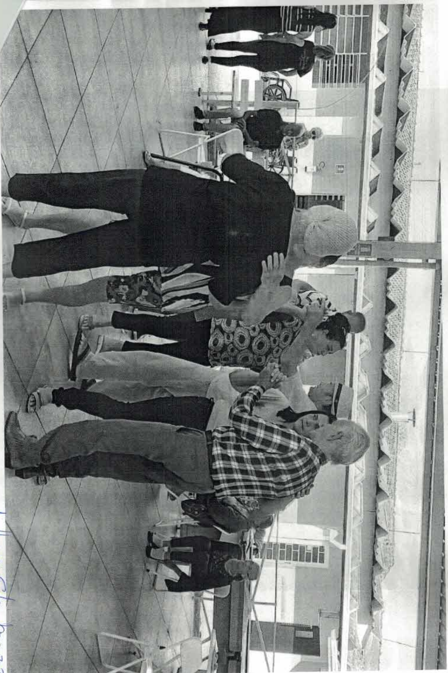
Julho a Setembro 2002